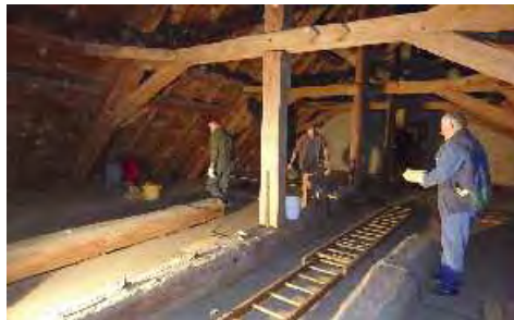
Une poignée de bénévoles se sont chargés des travaux de nettoyage du grenier et de la réfection du plancher de l'église St-Vendelin.