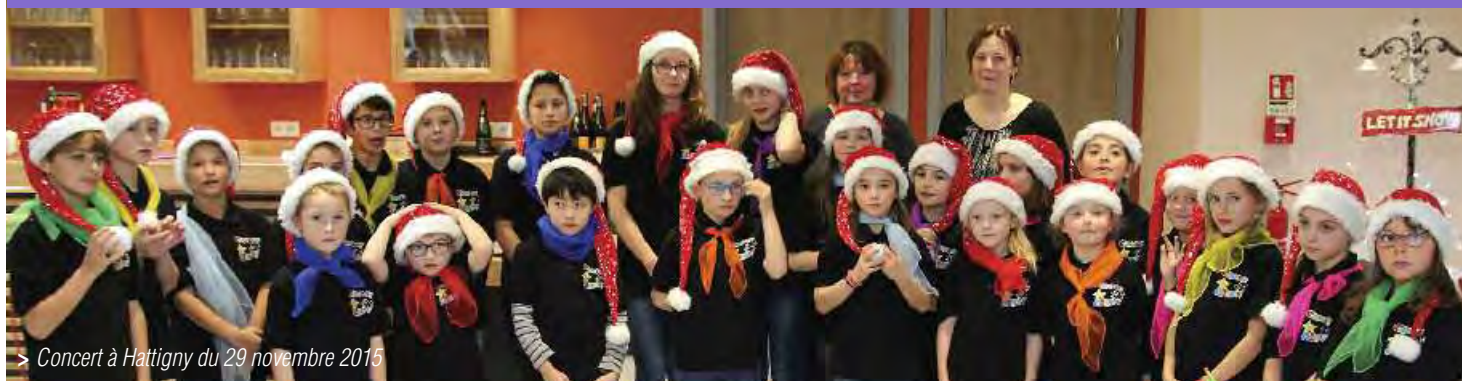
> Concert à Hattigny du 29 novembre 2015