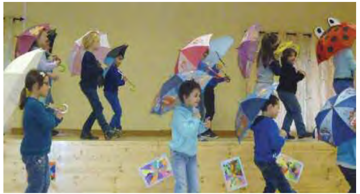
> La danse poétique des parapluies. CP/CE1 décembre 2015