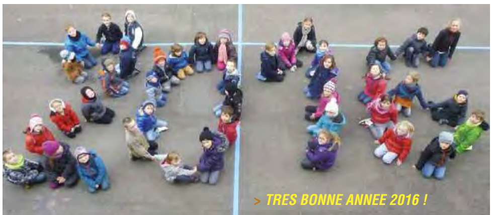
> TRES BONNE ANNEE 2016 !