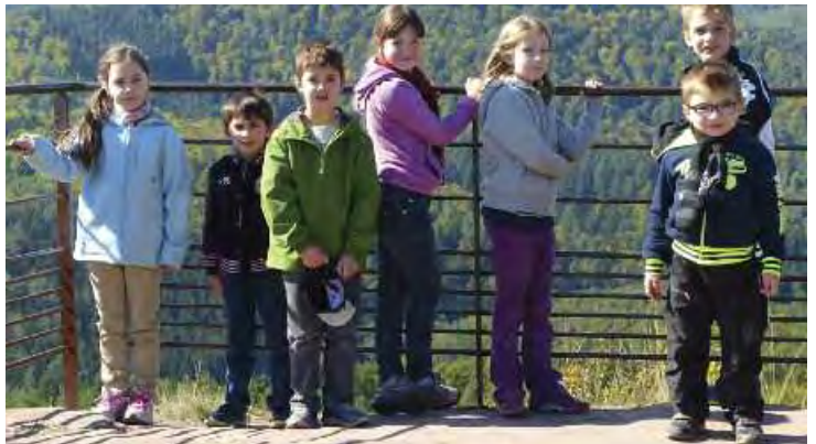
> Château de Fleckenstein, vue impressionnante d'une des tours.