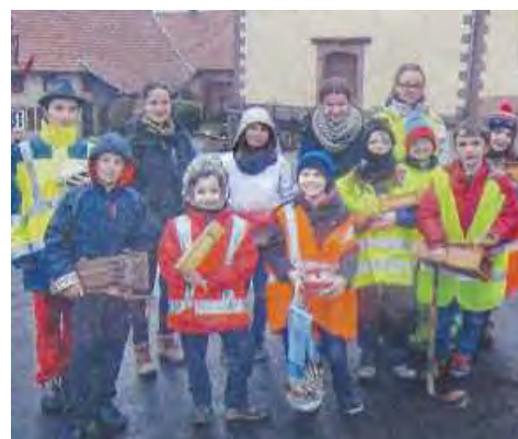
PÂQUES Les cloches se sont tues pour quelques jours, mais les enfants de cœur n'ont pas manqué à leur devoir de crécelleurs : ils sont passés par les rues pour annoncer les offices et au bout il y a les récompenses de Pâques (œufs, chocolats, monnaie...).

Sachez que si vous avez un problème de garde d'enfant, d'une manière ponctuelle, même pour une journée, le périscolaire peut vous dépanner. Pour le bon déroulement du périscolaire, il suffit de prévenir Mme Sylvie Tussing quelques jours à l'avance pour passer commande des repas.