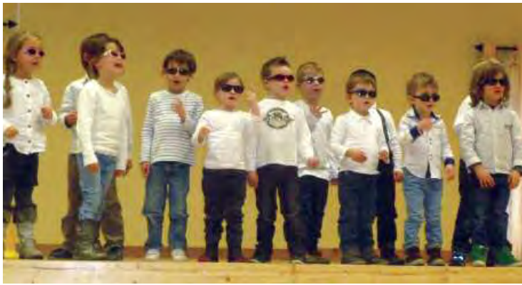
> Le Noël Rock and Roll des maternelles. Décembre 2015