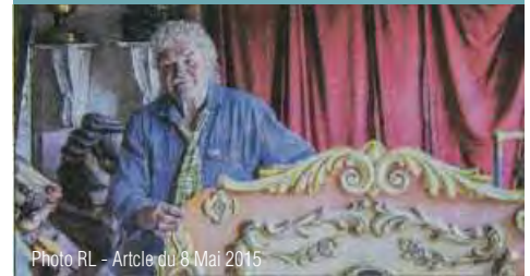
Artcle du 8 Mai 2015