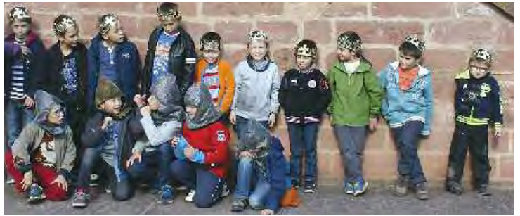
> Chevaliers et princesses à la découverte du château de Fleckenstein