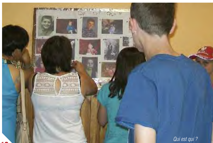
Qui est qui ?