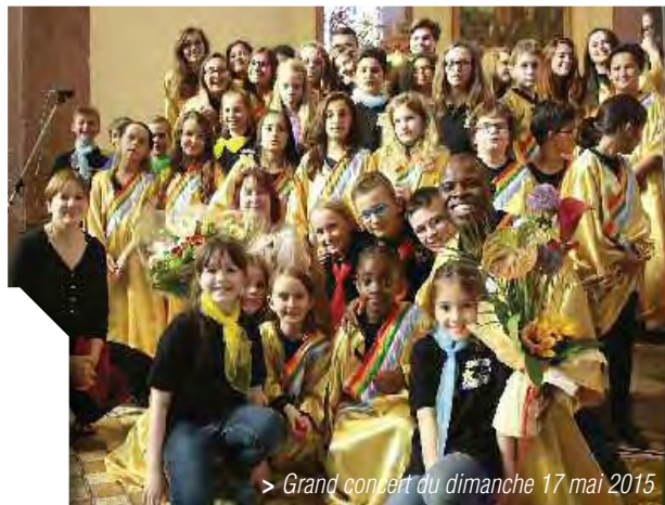
> Grand concert du dimanche 17 mai 2015

➔ “Le poème n'est accompli que s'il se fait chant, parole et musique en même temps.” Léopold Sédar Senghor