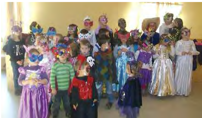
Association des Parents et Amis des élèves