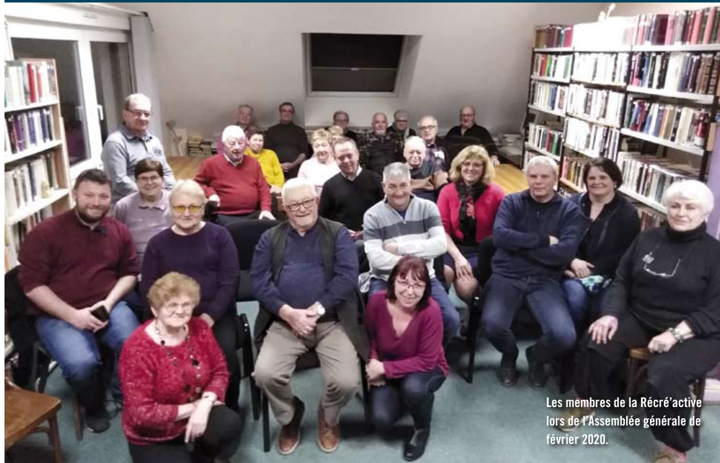
Les membres de la Récré'active lors de l'Assemblée générale de février 2020.