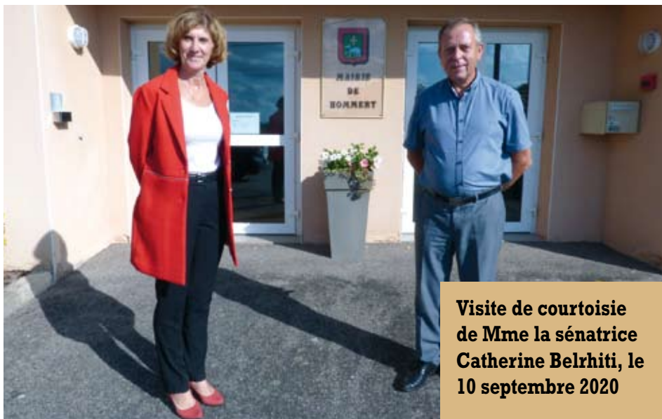
Visite de courtoisie de Mme la sénatrice Catherine Belhiti, le 10 septembre 2020