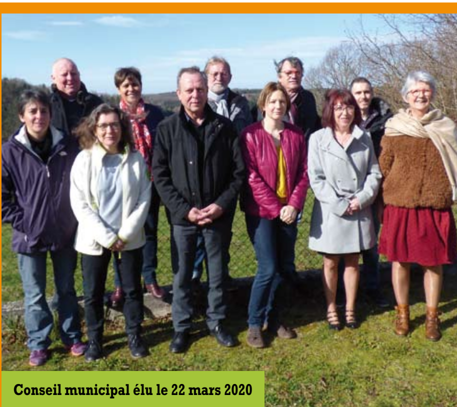
Conseil municipal élu le 22 mars 2020

Le 25 mai, les nouveaux membres du conseil municipal sont installés dans leurs fonctions :