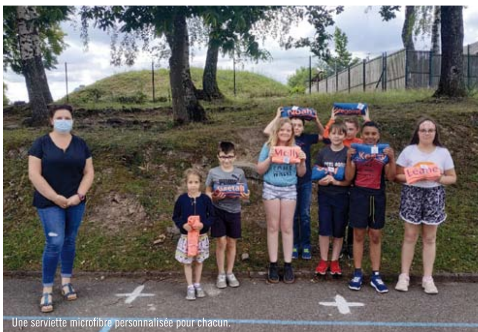
Une serviette microfibre personnalisée pour chacun.

Comme les autres années nous avons participé à la fête de St Nicolas organisée par l'école en offrant des livres aux élèves, offert des goûters d'Halloween et de Carnaval à l'école. Malheureusement avec la crise sanitaire nous n'avons pas pu offrir aux élèves un repas de fin d'année scolaire comme les années précédentes, ni de sortie de fin d'année. Les enfants étaient un peu déçus mais tous ont compris la situation particulière qui nous empêchait de leur organiser