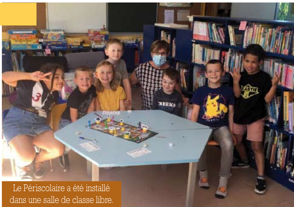
Le Périscolaire a été installé dans une salle de classe libre.

314 repas ont été consommés. De 5 à 7 enfants sont accueillis chaque jour par les bons soins de Sylvie Tussing.