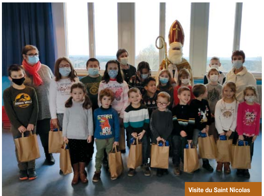
Visite du Saint Nicolas

2020 a été une année particulière, les projets ont été mis entre parenthèses par le Coronavirus. Les enfants ont alors dans un premier temps suivi des cours à distance grâce à internet et à leurs proches, puis sont revenus progressivement en classe. Ils ont pu exposer et partager leurs réalisations grâce au site « Ariane 57 ».